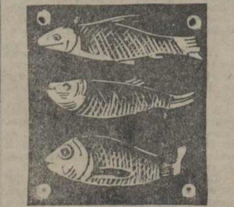
Рыбки, обнаруженные в пустыне Сахаре при бурении артезианских колодезей.

Последние французские журналы несли совершенно неожиданные сведения о том, что в песчаной, безводной пустыне Сахара, недалеко от некоторых артезианских колодезей вместе с водой стали попадаться живые рыбки. Маленькие, очень тонкие, но все же вполне живые, удивили всех ученых, которые обратились к этим артезианским колодезям. Но кто-нибудь мог вообразить, что под раскаленным песком существует какая-то жизнь? Теперь говорят, что Сахара была когда-то плодородной страной и что именно ее воды спустились и застыли в песок и образовали эти большие водоемы, где живут эти выбрасываемые артезианскими колодезями рыбки. Эти рыбки повели ученых еще дальше. Было найдено, что толь в таких-же рыбки живут в Галии, в озерце, в Палестине, а это основание ученым утверждать, что когда-то многоводные реки Сахары текли на восток и впадали в Средиземное море со стороны Палестины. Теперь нет сомнений, что под этой действительно существуют рыбки, которые сплошь и рядом в этих местах лежат не так уже далеко под поверхностью земли. В настоящее время французское правительство обсуждает проект од