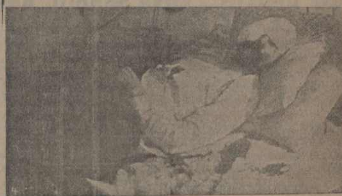
Збітця польскай поліцыяй і ахрынкай сябры беларускай грамады: Селаніч В.ўчоў, на кватэры якога знаходзіліся сабры грамады і удзельнікі конферэнцыі—Валашын і Мятла.