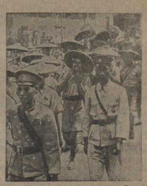
Юныя піянеры (гамінданаўская Ўрг.) на вуліцах Кантону.