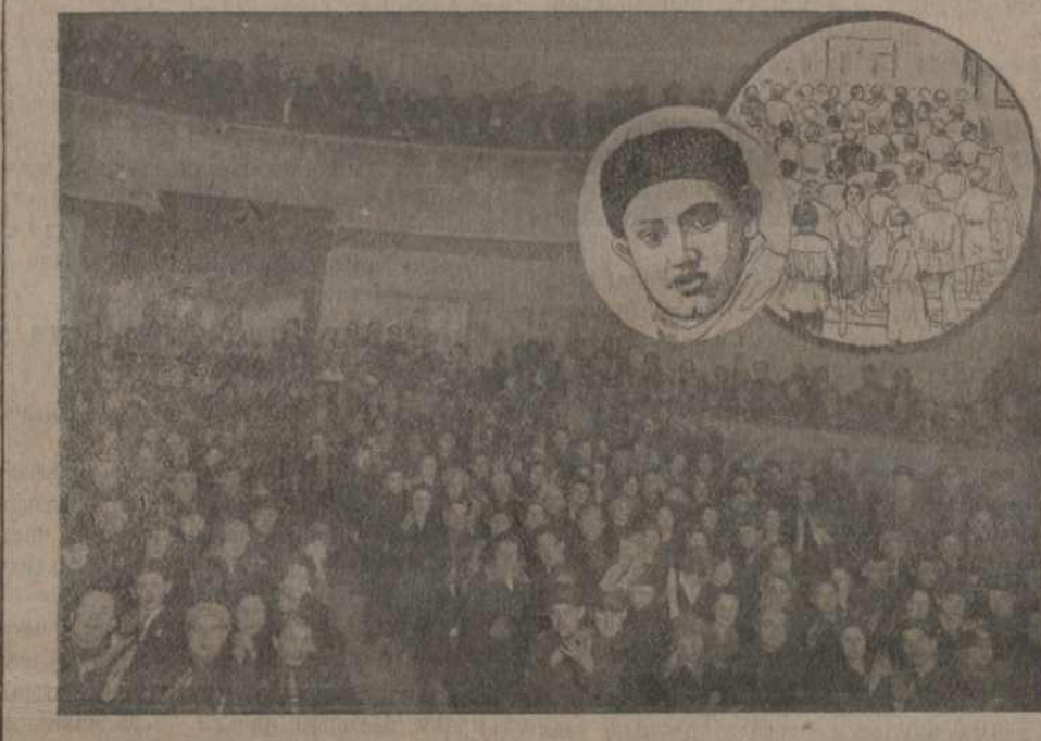
Аудыторыя Белдзяржтэатру 16 лютага. У авале—тав. Ароцкер.