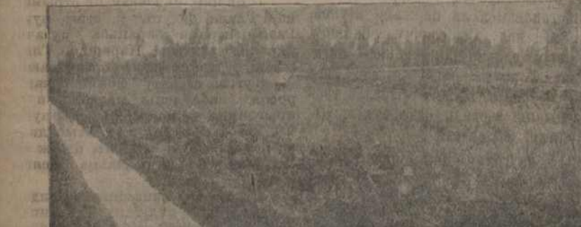
Мліорацыйная канава на балоте пасёлку «Перадавы Беларусі», Магілёўскай акругі.

Станцыя ў часе 1912 да 1917 году выдавала часопіс «Балотаведзеньне». Апрача паменшага яшчэ выдавала 15