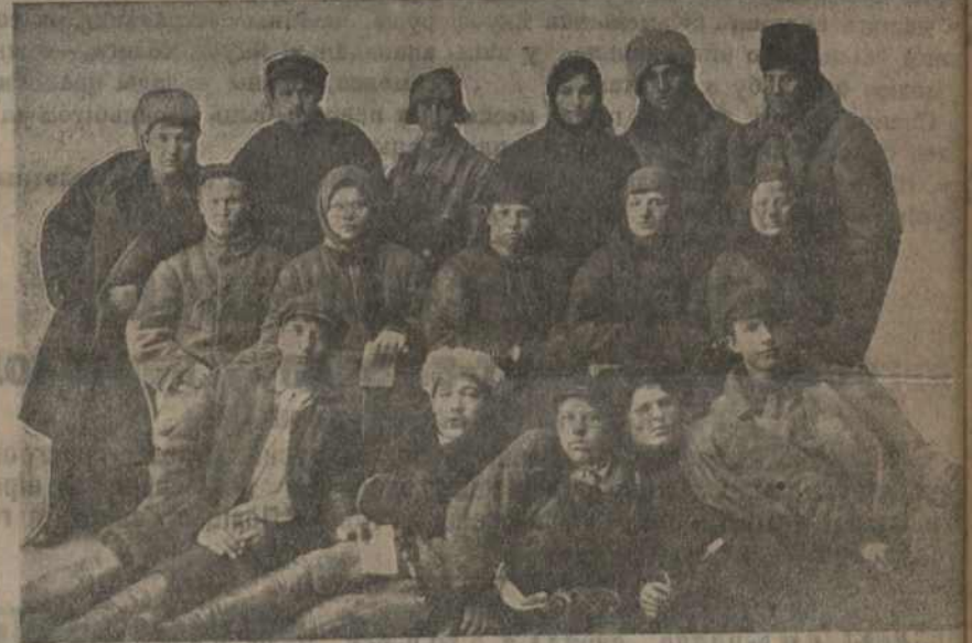
Дэлегаты апошняй канфэрэнцыі Калінінскай арганізацыі ЛКСМБ