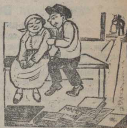
Таксама „даклад“ а? каханьні“.