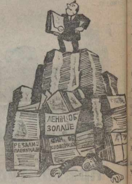
(Глядзі артыкул аб Бабруйскіх політшколе)