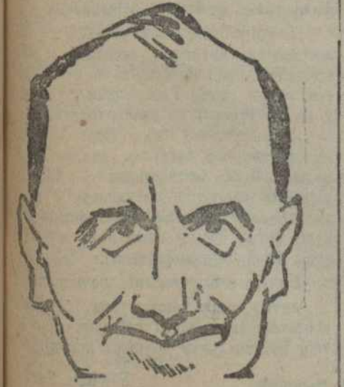
Негэратар пасьяла ноты.

Як раз, дзень 8-га сакавіка саўпадае з кампаніяй перавыбару саветаў. У дакладзе таксама можна больш спыніцца на гэтым моманце, звярнуўшы ўвагу на прыцягванне дзячат да перавыбару, на таварыскую дапамогу дзячатам у іх працы ў саветах.