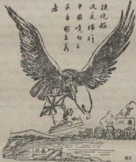
(3 часопісі Шанхайскага камсамолу)