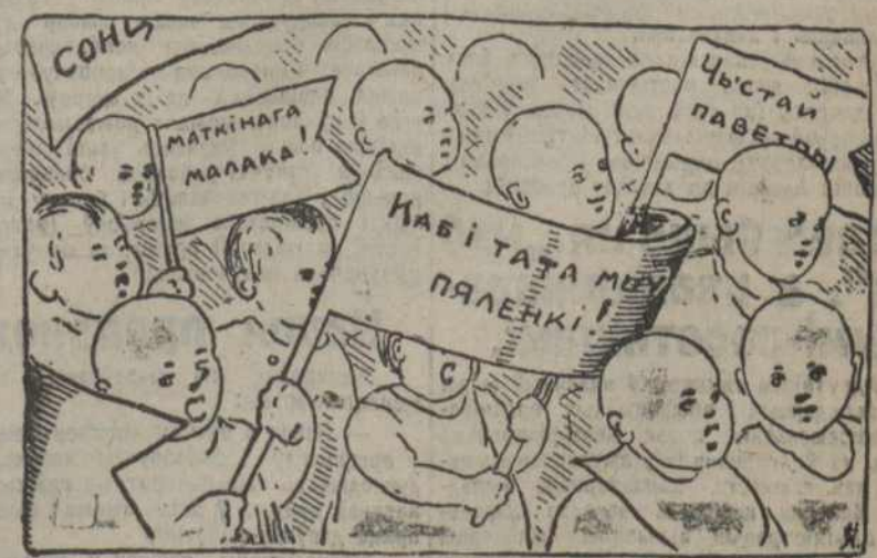
Што патрабуюць дзеці ад бацьноў-комсамольцаў.