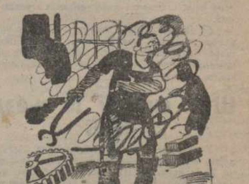
Трэба закладаць выхаваньнікі.

У канцы працы нарада прышла шэраг практычных прапапоў усім вытворчым ічэйкам, зьявіцца на 2 стр.