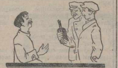
Бывае майстар любіць падарункі...

У канцы працы нарада прышла шэраг практычных прапапоў усім вытворчым ічэйкам, зьявіцца на 2 стр.