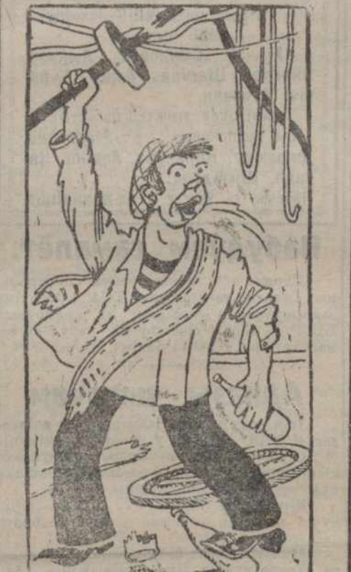
Дэўно вядомы тып.