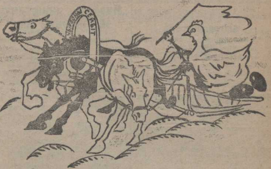
Наміж варты верб сьвёвелых. Добра несцься ў савях. (М. В. Вішнеўская, «Чырвоны Сьвіт» № 8—9)