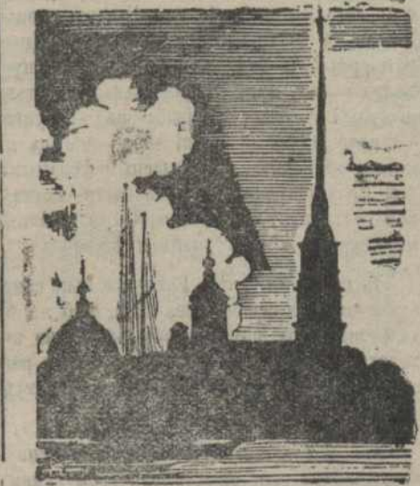
Рэдакцыя пачала атрымліваць рознакаляровыя канвертыкі, з наметкамі: экскурсіі, ў экскурсію, для экскурсіі, а іншыя хлапцы, на сваёй сьпешцы і запам'яталі пісаць гэтае слядо. Але бязумоўна, што ўсе заявы даходзілі да мэты—у экскурсійную камісію.

Пабачыць горад Леніна!—якія прыветныя гэтыя словы для кожнага маладога рабочага, работніка, селяніна... Але як кажучы: гані монету! Так і адарылася тут, бо раз хочаш пабачыць, дык у наш век, патрэбны грошы... Ды і грошаў ня мала... 40 рублёў бяг трымаць! Як толькі было абвешчана, што прымаюцца заявы на паездку ў Леніна горад, на Волхаўбуд, на «Парыскую Комуна»—