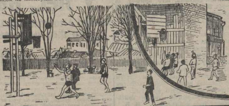
Гульня ў распале...

Ішчэ холадна на вуліцы. Вясеньне сонца падчас паказавецца з-за хутка плавучых па небасхілу хмарак, блісьне сваімі праменьнямі і зноў схавецца. Холадна... але не фізкультурнікам! Варта ім было толькі пачуць вясеньняе надвор'е, як высыпалі ўжо на летнія пляцоўкі. Сеньня першае таварыскае статканьне па баскетболу паміж камандамі будаўнікоў і працасьветнікаў. Весела, у адных трусіках скачучь каманды на пляцоўцы. Мяч штохвіліна, то ў адной, то ў другой сьціцы. Уважліва сочаць за гульняй сідзачы ў старонцы 2 хлапцы—прадаўнікі абодных каманд і запісваюць колькасьць „галюў“ кожнай каманды. Праразьлівы сьвісток кіраўніка, крыкі іграючых—скідай сюды, „аўт“, „штрафно“, „спрачыно“—усё гэта зьлінаецца ў шэста кіпучае, балэрае, як гэта вясеньні дзень... У выніку 31:19 у карысьць працасьветнікаў. Добра прашла першая вылазка. Р. Г.—