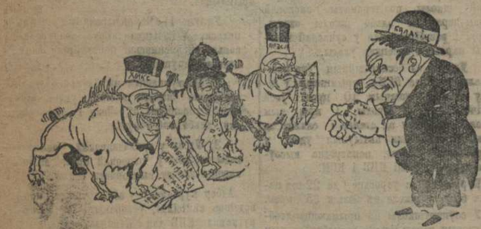
Сабань спусьцілі з ланцужаг

Прыч руні ад СССР. Рабочыя ўсіх краіў павінен аднавіць голас протэсту супроць новай правакацыі Імпэрыялістаў, накіраванай да зрыну міру.