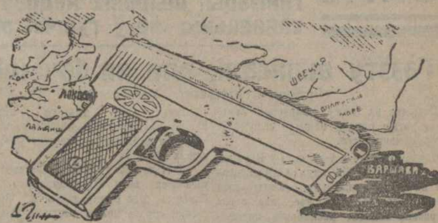
Бой—Лёндан—Варшава з гарантыяй