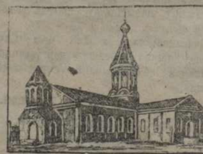
Царква Нова-Данскіх могілак у яе ранейшым выглядзе.

Першай натуральнаю перавагаю спосабу пахавання з'яўляецца неабходнасць час ад часу выдаваць дзеля могілак новыя участкі гарадскога зямлі. Праца, пры выданы тэрмін можа быць вельмі перакупаваная.