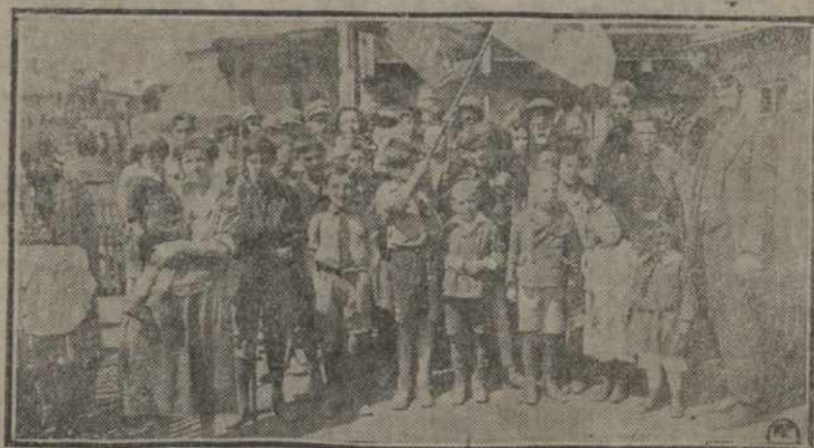
На здымку—атрад аўстрыйскіх піонэраў ў часе дэманстрацыі, арганізаванай аўстрыйскім комсамолам.