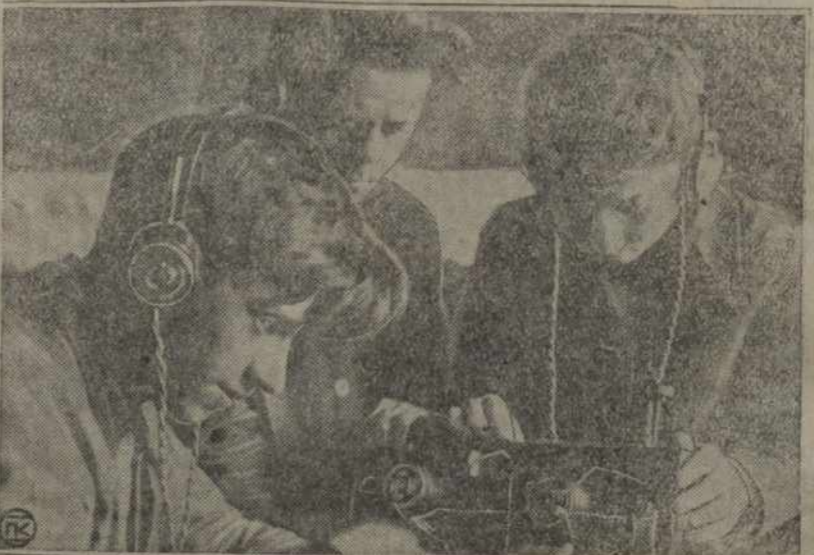
Маладыя радысты будуць свой уласны прыёмнік.