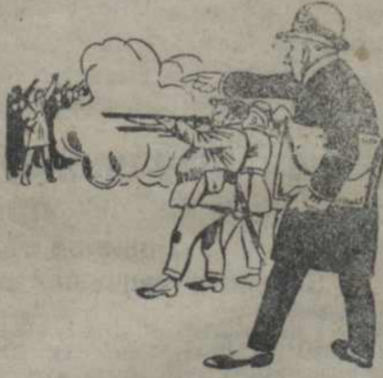
Вось чые рукі працягнуты да Кітаю

Рабочае пытаньне таксама не вырашана ў духу патрабаваньняў, якія высьцываюць рэвалюцыйнай часткай кітайскага пролетарыяту.