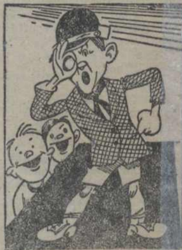
Як піонэры уяўляюць Чэмпэрлена.

Не хапіла ў нас інструмэнту. А грошай — няма. Падумалі: абстаўдзем, як абстаўдзіць інструмэнтамі ў піонэраў дома. Часта бывае так: ляжаць у піонэра дзе-небудзь у кутку ці малаток, ці абцугі, ці рубанак. А тут за кожную дробязь —