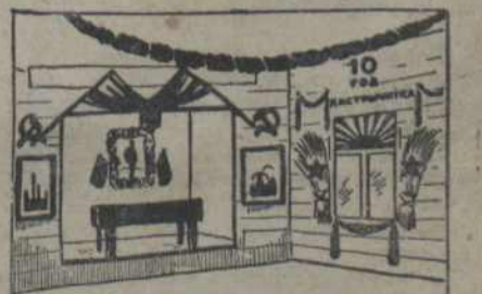
Ян павінен выгладзіць хатай-чытальню ў дзень Кастрычніка.