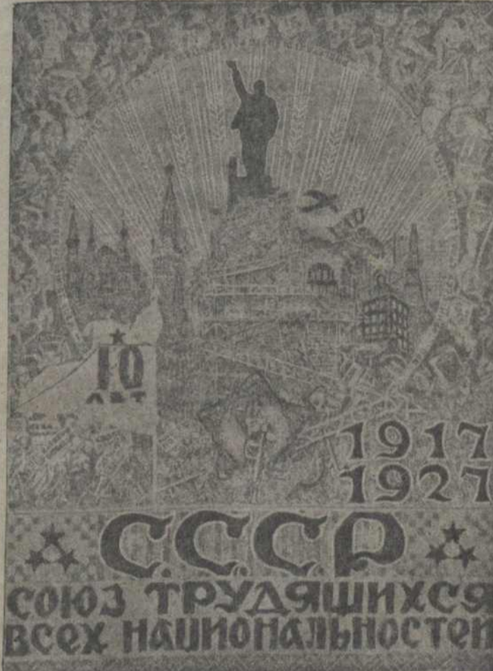
Адзін з плякатаў, выданы да дзесяцігодзьдзя Кастрычніку.

Аб значэньні гэтага абсьледаваньня, нават ня прыходзіцца гаварыць, уявім толькі любу нашую школу, якую налі-небудзь бачылі... Школьнікі ў час суботніку сабраюць ороды сарод сялян на рамонт і пабудову новых школ.