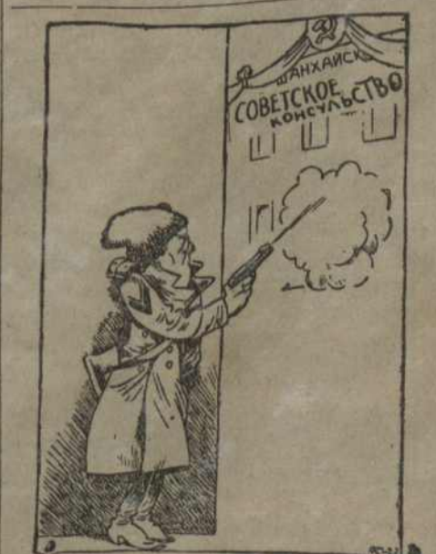
Да нападу белагардзейцаў на шанхайскае консульства.

Асабліва гэта відзець на прыкладзе выбараў у Гэсе, дзе комуністычная партыя аказалася адной з партый, якая павялічыла колькасьць галасоў, у параўнаньні з мінулымі выбарамі.