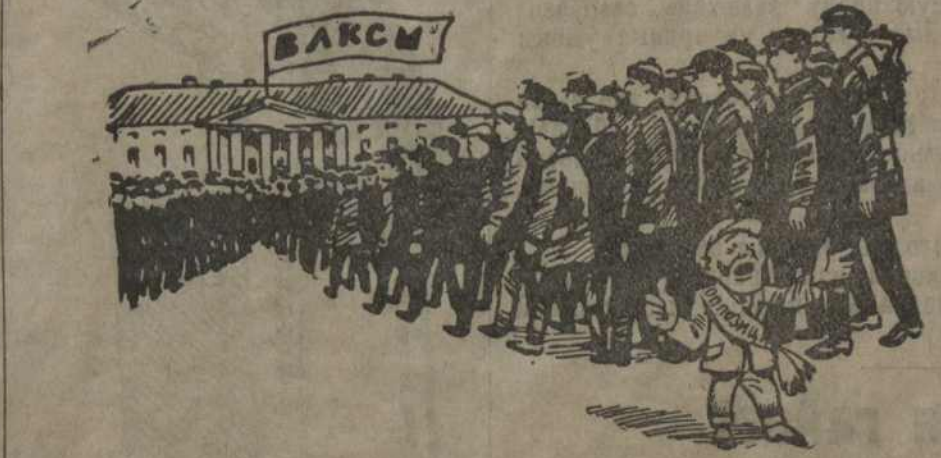
Опозіцыянер: А гавораць, што за намi масы ня ідуць.

Мы цьвёрда перакананы, што комсамол Беларусі, усе комсамольскія ячэйкі дадуць рашучы і моцны адпор усякім спробам парухіць адзінства ленінскіх шэрагаў.