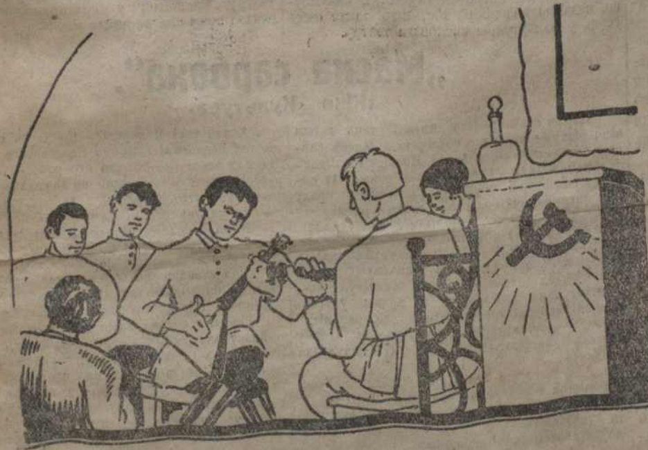
Організуюцца стрункія гурткі.