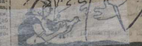
Папоўшчына і моладзь таксама павінны распачаць сваю падрыхтоўку да анты-каляд.

Павінна наладзіцца масавае чытаньне і працягвацца навука паўстаньня моладзі з абшчынаў. Усюды гэтаму брудна разумае і вольнае скарыстаньне вольнага часу!