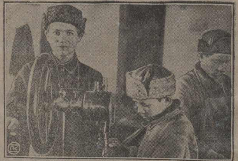
У Вятцы адчынены працоўны дом для падлеткаў—праванарушыцеляў. На здымку—выхаванцы дому за працай.