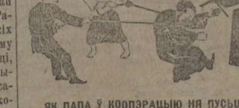
ЯК ПАПА У КООПЭРАЦЫЮ НЯ ПУСЬЦІЛІ.

Мэта дакладу—пказаць, куды вядуць моладзь рэлігійныя арганізацыі і як трэба весці барацьбу з іх уплывам на моладзь. На гэтую ў пляне дакладу зьмешчаны толькі матэрыялы, маючыя найбольш актуальнае значэньне для гэтай мэты. Але гэта ні ў якім выпадку не азначае, што ў дэкладах на гэтую тэму трэба замыкацца ў