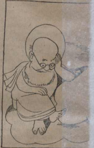
— Усемагутны наш, калі сына. — Ідзі ты к богу з нарадз хайтурамі пахне...

Для культурна-масавай працы ступуня літаратуры: Крапіва—«Біб-кач—Пра папоў» пра папоў, пр-зборнік «Комсамольскія вачоркі»; Т-Усе гэтыя кніжкі можна набыць.