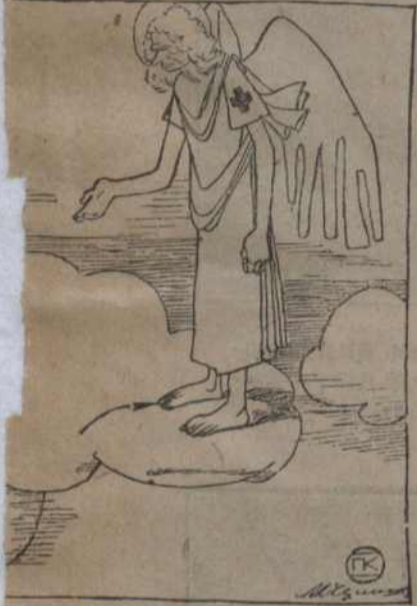
ла ска, узглянеце на нараджэньне сэннем. Тут для нашага брата

Так папы мужыкі ўсё пыталі ды пы- талі, а толку не дабралі: ці была ў па- па галава, ці не? Так і засталіся ня ве- даючы.