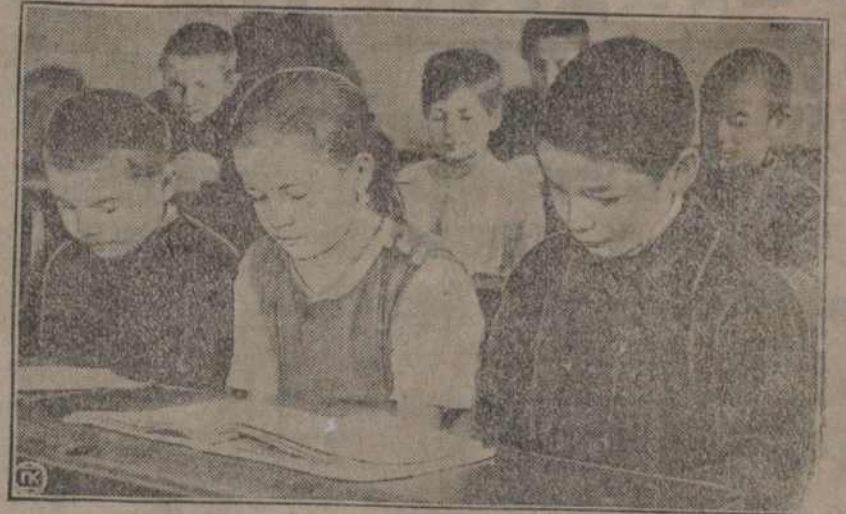
На здымку—дзеці на занятках у татарскай школе ў Казані.