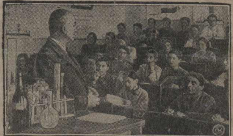
Заняткі па хэміі ў Прамыслова-Эканамічным тэхнікуме ў Тыфлісе (Грузія).