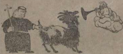
ГАСПОДЗЬ ПАЦЯШАЕЦА ДУХОЎНЫМ ПЕНЬНЕМ «ПАЦЯГНІ КАЗУ ЗА ХВОСТ».

Не званецце больш званы,— Я ўжо хлопец ня дурны: У рай нябесны не хачу я,— Тут мы лепшы пабудуем.