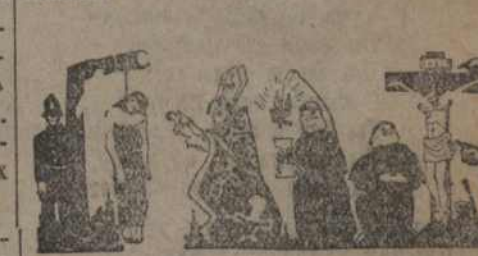
РАБОТА ПАПОЎ І ПАЛІЦЬНІ ПА ЛЕПШЫХ ДЫРЭКТЫВАХ, ЯКІЯ ДАЎ ІМ ГАСПОДЗЬ ІСУС ХРЫСТΟΣ.

Нам трэба ўсімі сродкамі і мерамі выкрыць зрадніцкую ролю рэлігіі і духавенства.