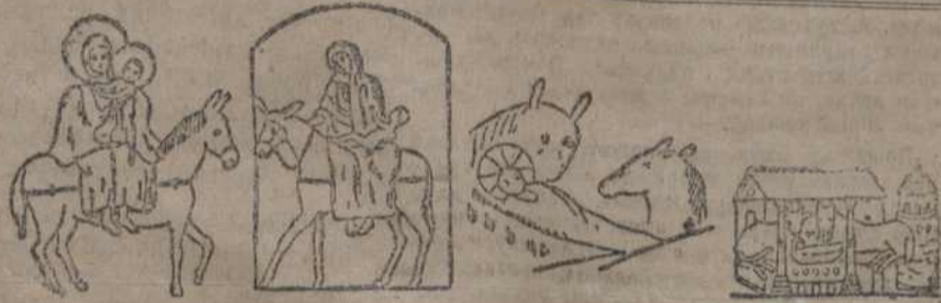
Малюнкі аб нараджэньні Хрыста.

Гульня владуць рукі на падлогу і выплываюцца на ўсю даўжыню навад. Па падданому знаку партыі ідуць на руках уперад, цягнуць ногі на падлозе.