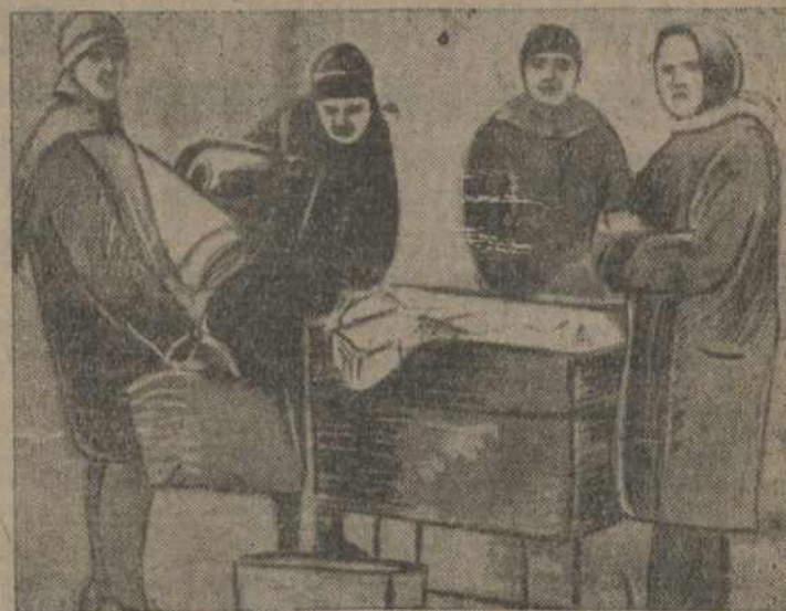
НА ЗДЫМКУ: збіраюць макулатураю.

Гэтымі днямі піонеры і вучні Менску наладзілі паход за макулатураю