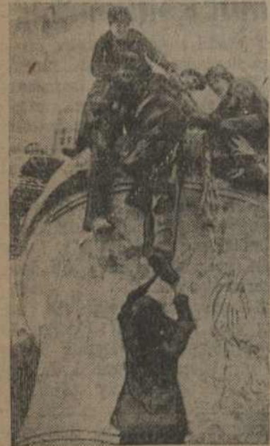
На здымку: зьняты звон.

Самы вялікі звон у СССР былой Тройка-Сяржэўскай даўры вагою ў 4000 пудоў, які зьняты 3-га студзеня 1930 году, будзе пераліты на неабходныя для краіны сельска-гаспадарчыя машыны.