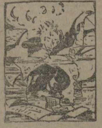
Там, дзе сарваўся зьлёты