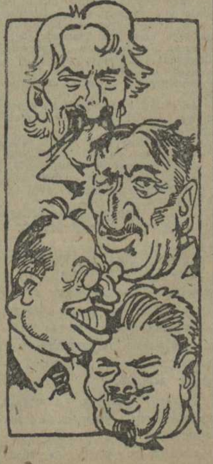
Зьверху ўніз: Манданальд (Англія), Стымоон (ПАЗШ), Тардзьё (Францыя), Гранды (Італія)

Галоўныя акторы на лэнданскай камэдыі па „марскім разброеньні“