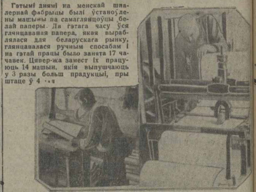
На здымку: зьлева—праца ручным спосабам, справа—праца на новых машынах.

Комсамольцы і беспартыйная моладзь м. Лепеля не займаюцца фізкультурай, ня глядзячы на тое, што ўсе неабходнае для гэтай працы маецца. Партыйныя, комсамольскія і профэсійнальныя арганізацыі гэтай надзвычайна важнай справе не аддаюць належнай увагі. Летні сезон прамагаралі. Былі некаторыя пачынаньні па фізкультурнай рабоце з боку моладзі і саюзу будаўнікоў, але, не атрымаўшы належнага кіраўніцтва, ініцыятыва загінула. ДА ЗІМОВАГА СЭЗОНУ ПАДРЫХ- ТОЎКА НЕ ВЯЛАСЯ. Маецца даволі добры спартыўны клуб, але ў ім ніякай работы па фізкультуры не вядзецца. Райком комсамолу, дзе-ж тваё кіраўніцтва фізкультурнаму? М. Е.