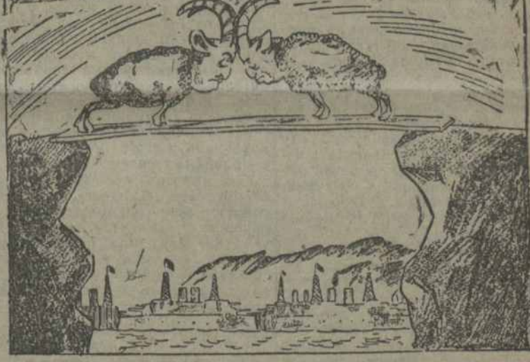
Марское разброеньне ніяк ня можа зрушыцца з месца...

Разнагалосьці на лёнданскай канфэрэнцыі ўсё ўзмацняюцца. Італьянскі і французскі дэлегацы ўступілі ў жорткую сварку ўжо пры абгаварэньні арганізацыйных пытаньняў, паказаўшы такім чынам няпрымірмасць імперыялістычных інтарэсаў. (3 газэт).