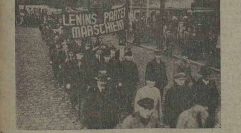
НА ЗДЫМКУ: дэманстрацыя, орга ізіваная нямецкай кампартыяй паходзіць па вуліцах Бэрліну. Наперадзе дэманстранты з лэўнгамі: „Партыя Леніна ідзе“.

Тыдзень Леніна, Лібкнэхта і Люксембург у Нямеччыне