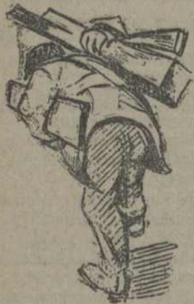
Гнула пад цяжарам хламу

амаль 100 проц., чаго ніколі ня было. Ня было „дээртыраў“. Праўда, былі некаторыя падобныя на „маменькіных сынку“, якія гаварылі: „Што, мы ўсякую дрэн будзем браць рукамі?“ Але такіх было зусім мало—адзінакі. Прыйшлі хлопцы з санкамі ў адзін двор, а гаспадыня іх сустракае: