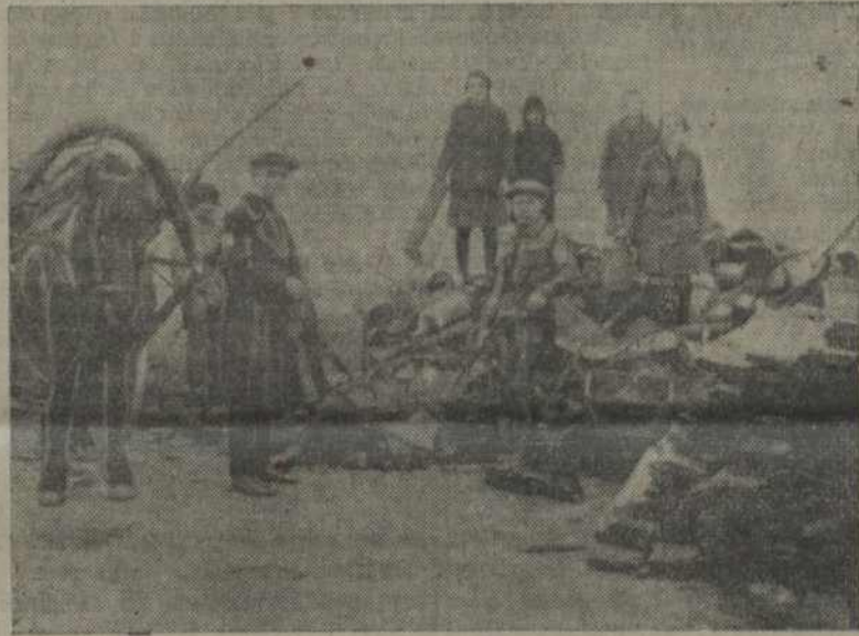
НА ЗДЫМКУ: удзельнікі паходу здаюць уціль і лом.