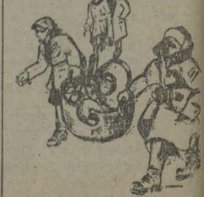
Адны працавалі актыўна, а Буаі прывяжаў з Верабей