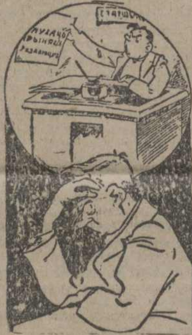
— Як успомню аб лесазагатоўках, дык вена ўцяляю абаб дубовую абстаноўку ў акрыжнаньне.

З боку акруговага праўленьня саюзу Працямлесу наогул нічога ня зроблена. Гэтым пытаньнем саюз, на вялікі жаль, зусім не займаецца. Працаўнікі акруговага праўленьня саюзу адказваюць: „ПАКОЛЬКІ ДА НАС СКАРГАЎ АБ ЭКСПЛЭАТАЦЫН НЕ ПАСТУПАЕ, ДЫК ЧАГО-Ж НАМ ЛЕЗЬЦІ ў ЯКІ-ЯСЬЦІ ЛЕСАЗАГАТОВКА“. Брыгады і арцелі лесаарыхтоўчых батракоў, беднякоў і сярэднякоў не аргані-