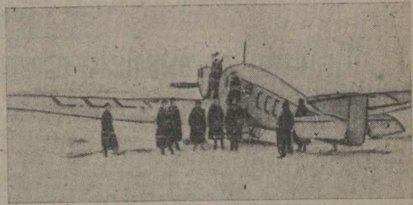
На здымку: агітсамалёт «Усе ў ТСА-Авіахэм»

14 га лютага вьіпаж выступіў а дакладам у часе абеднага перапынку ў першай друкарні, на швайнай фабрыцы «Бастрычнік», а ўвечары—у Даме Комасьветы імя Карла Маркса.