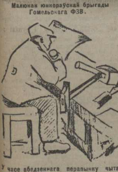
У часе абедзеннага перапынку чытае "Чырвоную Зьмену"