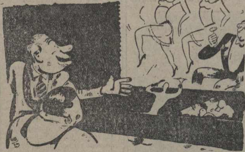
Чым кормяць гледача