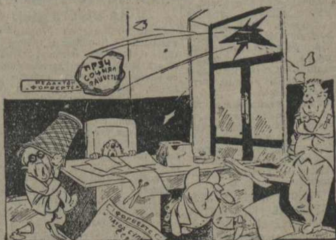
СУПРАЦЮНІК "ФОРВЭРТСА" (РЕДАКТАРУ): — Супанойцеся, шэф! Гэта рабочыя масы вітаюць наш орган.

На забараненне Цэргібелем "анты-фашыскай гвардыі" рэвалюцыйна моладзь Бэрліну адназала бурнымі дэманстрацыямі. Прайшоўшая міма рэдакцыі соцыял-фашыскага "Форвэртса" налізна дэманстрантаў закідала яго воны наменьнямі ў знак пратэсту супроць ганебнай анты-савецкай кампаніі, на чале якой стаіць гэты карэлы лісток.