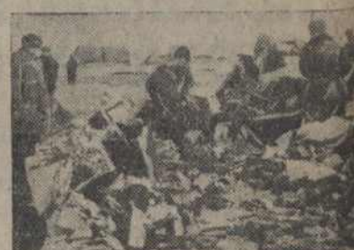
На здымку: Сабраная Уціль-сыравіна комсамольцамі менскай аб'яднанай профтэхшны.