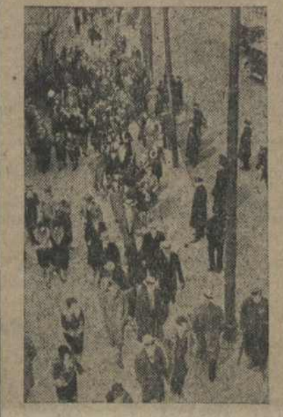
На здымку: Дэманстранты пакідаюць Колізеі.

17-га сакавіка кампартыя і левыя профсаюзамі быў скліканы вялізарны мітынг протэсту супроць паліцэйскага ўіску і усёй узростаючага беспрацоўя. Мітынг адбыўся ў Колізеі Бронка ў Нью-Ёрку і сабраў каля 25 тысяч дэманстрантаў.