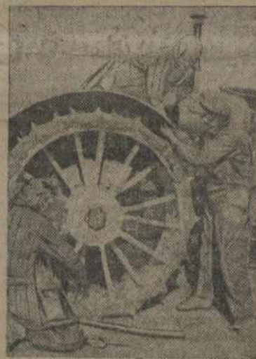
Ударніцы рамонтуюць трантар

У гэтым жа сельсавеце ёсьць колгас „Вольны Край“, які вельмі слаба выдзе работу па падрыхтоўцы выхаду ў поле. Інвентар не адрамантаваны.