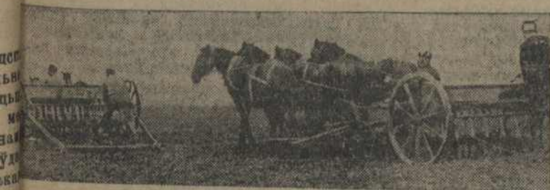
На здымку: работа сяляк у полі.