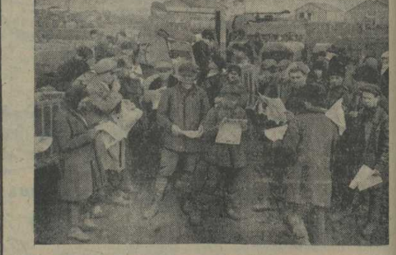
У часе адпачынку чытаюць "Чырвоную зьмену"