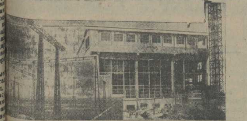
Злева направа: адкрытая жалезная падстанцыя і галоўны корпус электрастанцыі Асінобуду

У мінулым годзе загатоўлена і прывезена да галоўнага корпусу Асінобуду паўтара мільёны пудоў торфу. У гэтым годзе на пляну намечана распрацаваць 65 тысяч тон будучы працаваць 11 машын і 2500 рабочых. Торпараспрацоўкі вялізарных асінаўскіх балот разлічаны на 100 год пры ўмове калі будучы працаваць 37 навейшых машын. Будаўніцтва памяшканьняў для рабочых Асінобуду амаль закончана. Для сэзонікаў пабудаваны баракі. Зараз уся ўвага аддаецца скарачэнню ўстаноўкі машын у памяшканьні галоўнага корпусу. Аб-