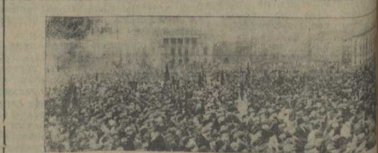
5-ты ўсенімецкі конгрэс „дзень рабочай моладзі“, які адбыўся 21 красавіка ў Лейпцыгу, ператварыўся ў баявы агляд рэвалюцыйных сіл моладзі. Агляд адбыўся ў Лейпцыгу, бо гэты горад зьяўляецца цэнтрам соцыялізму. Ня глядзячы на шаленую антыюніістычную агітацыю фашысцкіх „прорыў і масам“ упаўна ўдаўся. У дэманстрацыі ўдзельнічалі 100 тысяч рабочай моладзі. Дэманстранты былі поўным баявым тузізмам. Начальнік паліцыі Флэйнон-лезы соц-дэмакрат наладзіў прывокацыю, у выніку маюцца забітыя і раненыя. На здымку: агляд сіл на дэманстрацыі.

Цэнтральны стачачны камітэту гарнуў энэргічную камітэту стварэньне стачачных камітэту кожнай фабрыцы. Камітэты могу бастуючым, арганізаваць Лендане, Гавго, у некаторых гарадох арганізуець мітынгі, прадстаўнікі шарсьцянікаў пайдз з заклікам падтрымаць стуючых.