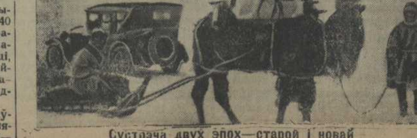
Сустрэча двух эпох—старой і новай

З дня пастановы Савету Працы і Абароны прайшоў няпоўны пяць год, і мы ўжо заканчваем будаўніцтва Турксібу. 28-га красавіка на 6-м вучастку будаўніцтва ўкладзена і замацавана апошняя рэйка, якая злучыла паўднёвую частку чыгункі з паўночнай. Магутны паравоз, загнулаючы сваім гулам сьвешнюю пустыню і заўтрашні