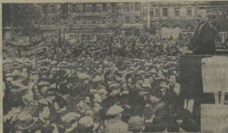
НА ЗДЫМКУ: Правадыр кампартыі Нямеччыны т. Тэльман вітае маладую гвардыю.

У дэманстрацыі ўдзельнічала звыш 100 тысяч рабочай моладзі.