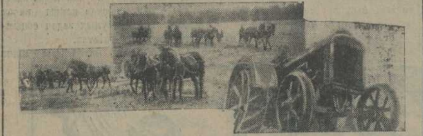
Загулі трактары, закіпела на палёх колектыўных, бяз меж, веснавая праца

Увесь час не атрымаў ніводнага ліста. Адзінае, што напамінае Зубарыку аб сваіх заводзкіх таварышох — гэта паштовай пераходзіць работу. Былае так, што Зубарыку няма з кім параіцца, пагаварыць аб рабоце. Ячэйкі няма. Комуністых усяго два чалавекі: ён старшыня сельсавету ў раён далёка... А бёння, калі з Акрпрофсавету была атрымана надрукаваная паперка (відавочна пасланая да ўсіх 25 тысячнікаў), яго асабліва абурьвае адзін абзац. Там было напісана: "Між тым да гэтага часу гэта сувязь паміж намі ня была наладжана, у чым мы таксама бярэмі віну на сябе". — Таксама... — злона паўтарыў Зубарык. — І гэта пішуць ня толькі мне, Зубарыку, а ўсім іншым таварышам вёскі. Ён успомніў як на ўрачыстым пасаджэньні, калі іх праводзілі ў вёску прадстаўнікі акруговых ор-