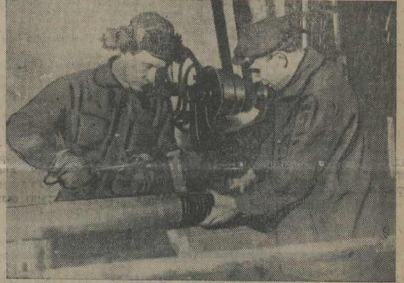
...Пад шопат праводных пасаў ідзе ударная праца...