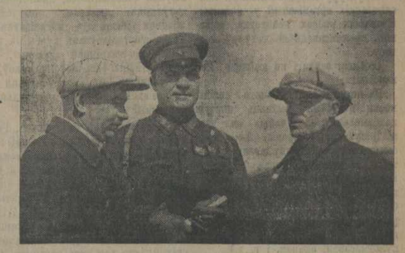
НА ЗДЫМКУ: зьлева направа: т. т. Калінін (Старшыня ЦК КП(б) і МКРСІ), Ягораў (Камандуючы Беларускай Вайсковай аругай) і Ваюленіч (сэкратар ЦК КП(б)Б).

Вечар. 30 красавіка. Менск у электрычнасьці. Ляпачкі Ільліча рознымі фігурамі, вівагамі ўбрали памяшканьні і вуліцы Менску. Сьцягі. Адчуваецца вялікая бадабрасць і надзвычайнае ажыўленьне. У клубах урачыстыя пасаджоны. У Доме Будытуры ўрачыстае пасаджоньне Менскага Гарадскога Савету, прысьвечанае Першамаю. Рабочыя рапартуюць гарадскому савету: колькі імі кінуто брагод у вёскі па рэканструкцыі сельскай гаспадаркі, як вядзецца шырокая культурна-масавая работа, аб удзеле рабочых ва ўсім будаўніцтве. 1-га мая раніцаю вуліцы Менску жывуць урачыстасьцю. Калёны рабочых з заводаў і фабрык, комсомольскія арганізацыі, профсоюзны,