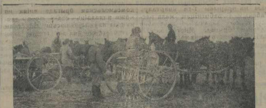
Колгаснікі перад выездам у поле