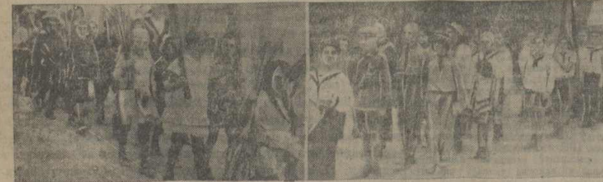
Дзіцячыя калёны на дэманстрацыі