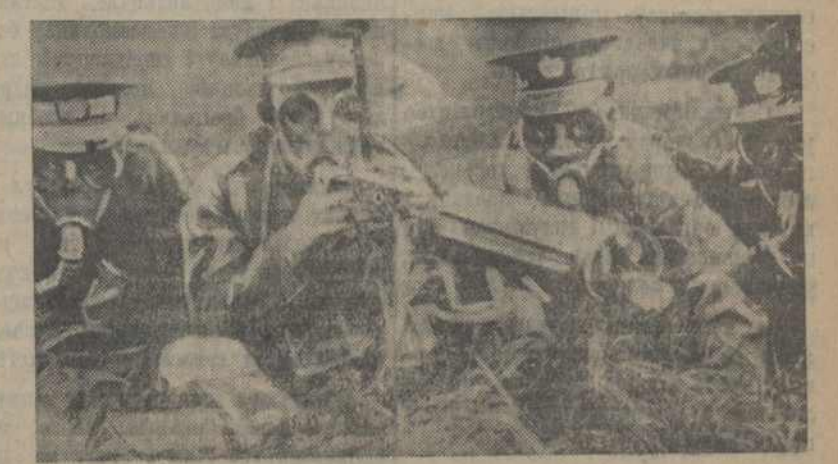
На задмыну: Стралініна з газавых кулямётаў.

На манэўрах ангельскай арміі ўпершыню былі выпрабаваны газавыя кулямёты, якія далі надзвычайна добрыя вынікі.