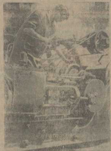
Комсамолка-ударница за працай