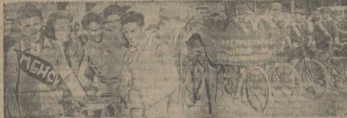
На здымку: зьлева—менская вэлэспыядная каманда, справа—фініш аршанскай каманды.

1-га чэрвеня г.г., на пляцы Волі (Менск) адбыўся фініш усебеларускага зьвёзднага вэлэпрабегу. А 8-й гадзіне на пляцы сабраліся калёны менскіх фізкультурнікаў для сустрэчы прыбываючых, якія сумесна з вэлэспыядыстамі Менску, Воршы, Гомелю, Віцебску, Бабруйску, Полацку і Магілеву агульнай калёнай накіраваліся к будынку, дзе працуе 13-ты зьезд КП(б)Б, і аддалі рапарт аб праробленай прабоце. Прэзыдыум зьезду вылучыў дэлегацыю для прывітаньня удзельнікаў прабегу і прыняў рапарт.