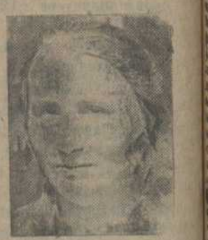
Тав. Т. Газ—сэкрэтэр партколектыву саюзу будаўнікоў (Гомель)