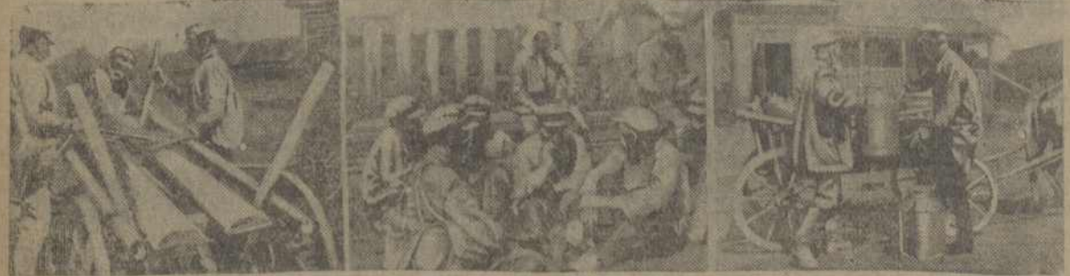
Зьлева: 1. Пачынка інвентару. 2. У часе абаронага перапынку. 3. Адрывка малака.

Задача будаўніцтва сваіх прамысловых гаспадарак зьвужаецца ўдарнай. Комсамол павінен мобілізаваць свае сілы, бо краіне патрэбна мяса Н. Гараленкаў.