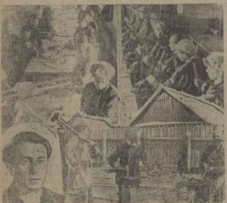
Зьлева зверху сталярная майстэрня. Знізу загадчык будвучу тав. Мурох. З правага боку—сь.ясарная, ніжэй—кузьня