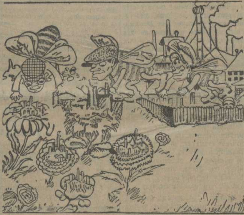
Іх праца — „лецець“ рваць...

комсамол часцей за ўсё толькі нагледзецца, а часам нават і патураюць гэтым зьявам.