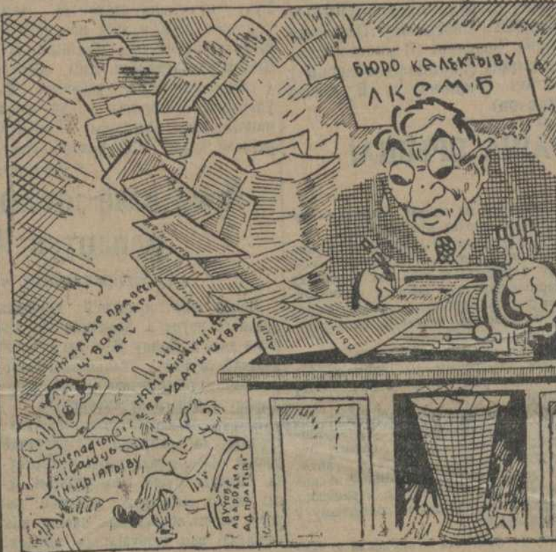
Па-старынку ў паводзінчай мітусяніне...