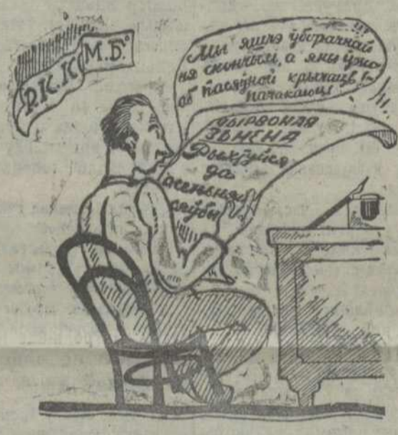
так некаторыя камітэты і арганізацыі „вырашаюць“ гаспадарчыя задачы

вадзячасьці колгасу на сходах колгаснікаў і асабліва адзіналічнікаў аб выніках працы колгасу, даводзячы да кожнага працоўнага жывою і працавую колектыўную гаспадарку. в) РК і ячэйкі КП(б)Б у значна большай меры павінны выкарыстоўваць адбываючыся зараз Першую Усебеларускую Выстаўку Сельскага Гаспадаркі і Прамысловы для правядзення масавай работы за суцэльную колектыўнасцю, шляхам арганізацыі дакладаў колгаснікаў і некалгаснікаў з курсантаў бядняцоў і с-раднякоў на агульных сходах аб выніках агляду выстаўкі і шляхам значна большай пасылкі на выстаўку адзіналічнікаў бядняцоў і с-раднякоў, асабліва жанчы; г) правесць работу ячэек па арганізацыі батрацтва і бядняці, рашуча паліцьшы ў іх работу батрацка-бядняцкіх груп, накіраваўшы працу ў іх і ўва ў на пытанні вытворчасці і барацьбы з кулацтвам.