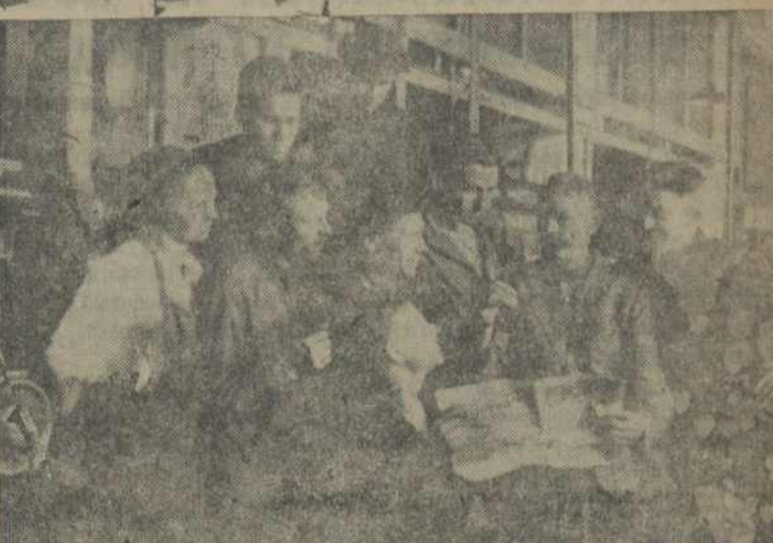
На здымку: ударная брыгада імя XVI МЮД. У цэнтры — старшы рабочы — ганаровы брыгадзір.

Комсомольцамі с'ялярна-такернага цеху заводу Мосэлектрык арганізавана ударная брыгада імя XVI МЮД. У склад гэтай брыгады, у якасьці ганаровых брыгадзіраў влілі тры рабочых з вялікім вытворчым стажам.