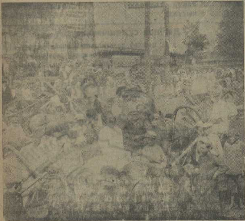
Чырвоны абоз, арганізаваны арцельлю імя Чарвякова