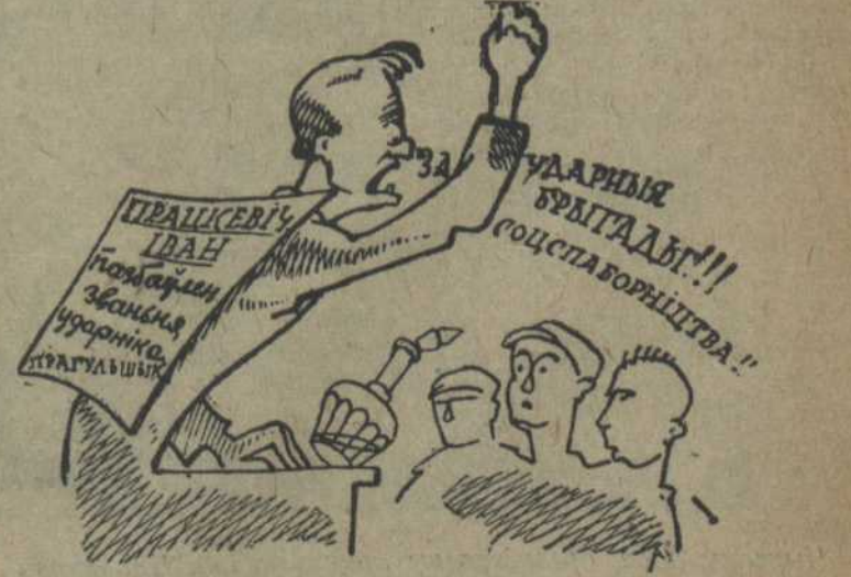
ПРАЦКЕВІЧ ІВАН сумяшчае несумяшчальнае званьне сэкрэтара і прагульшчыка.

Сэкрэтара аддз. цахавай камсамольскай ячэйкі заводу «Комінтэрн» Працкевіч Іван пазбаўлен званьня ўдарніка за частыя прагулы на заводзе. (3 допісу юнкора)