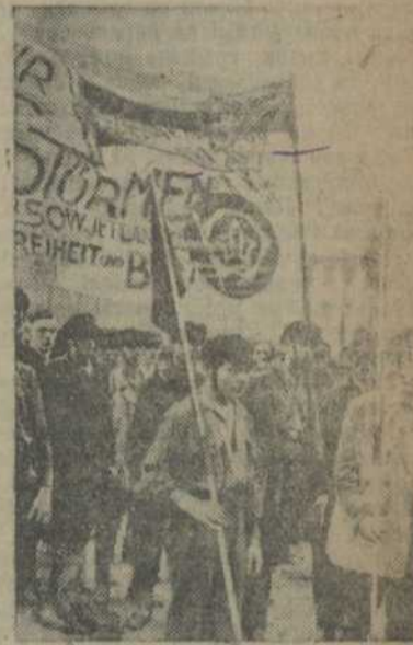
чыўся новым прытокам малядых рабочых у комсамол. У перыод падрыхтоўкі да МЮД'у ў Берліне ўступіла ў комсамол княя 350 рабочых, а ў Рурэ—59 і г. д. На адымку: колёна дэманстрантаў.