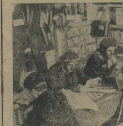
У чырвоным прышываюцца лункі

Крыж і маўзэр — вась на што абаранялася царская ўлада ў падрыхтоў-