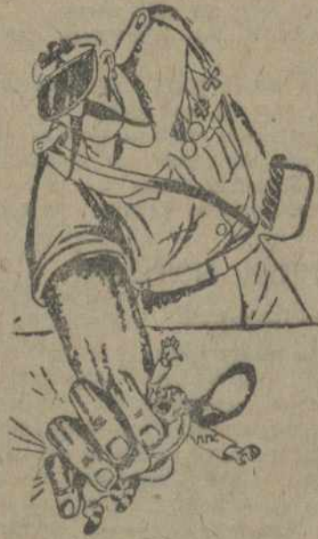
ППСавец: Пане маршале, вы напэўна памылліся... Мы ж не бальшавікі!

Забаставалі таксама 1.500 будаўнічых рабочых. Часткова бастуюць фабрыкі табачнай монополіі. Трамвай, электрастанцыі і комунальным прадпрыемстваў працуюць нармальна. У пэнэсаўскіх колах катэгорычна заклікаюць, што ППС ня вынесе рашэньня аб абвешчэньні забастойкі.