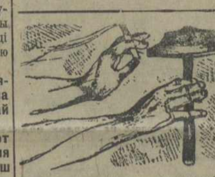
Валасць, гультайства з заводу гані!