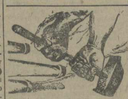
Рабочы, у поход за ударныя дні,

Але факт застаецца фактам. На працягу цэлага году стаіць адзін варстат і яго ня выкарыстоўвалі для кваліфікацыі моладзі, ня глядзячы на тое, што рабочыя і прадстаўнікі ЦПС аб гэтым гаварылі. Пры жаданні можна правесці аднаведныя ўплатненні (а рабочыя на гэта пойдучы) да сканчэння будаўніцтва новых дамоў, пры больш