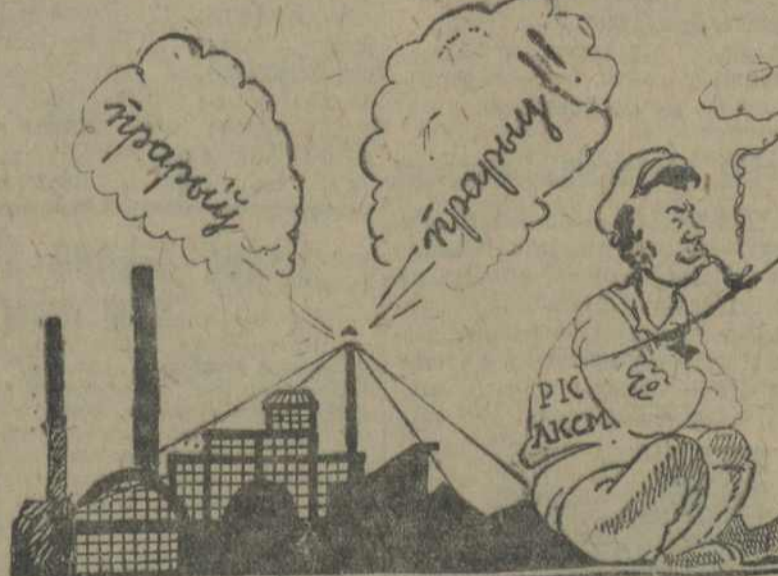
Прарыв? Няхай будзе прарыв—гэта нао не датычыцца

гэтых думак прытрымліваецца і Пётрыкаўскі РК. На глядзячы на тое, што ў выкананьні прамфінплану на мясцовых прадпрыемствах маецца цэлы шэраг прарываў, усёж