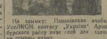
На здымку: Панакінская ячэйка УсеЛКСМ колгасу „Україна“ Аршанскага раёну вязе хлеб для здачы на сьмны пункт.

шчэным насеньнем, за атсутнасьцю зернаачышчальных машын, штучнае ўгнаеньне ў колгасях ня ўводзіцца, 15 вагонаў штучнага ўгнаеньня ляжаць на станцыі некарыстанымі абраныя попель высыпан у балота. Дрэна таксама праходзіць кантрактыя; павінна быць закантрактована 1200 гэктараў, а закантрактована зусім ніводнаго колькасьці.