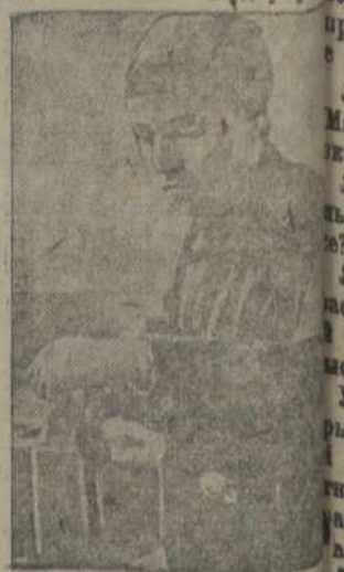
Студэнтка хэміка-тэхнічнага інстытуту тав. на практычных занятках заводзе "Энэргія" (Менск)

Калі іхнія прозьвішчы новыя, дык—Л.віна, Пунывітас і ішныя з Будвучу