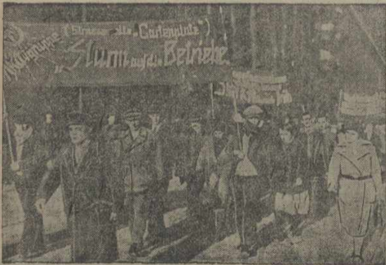
15-Х у Бэрліне пачалася ўсеагульная стачка мэталістаў. НА ЗДЫМКУ: Дэманстрацыя мэталістаў перад будынкам заводу АЕГ