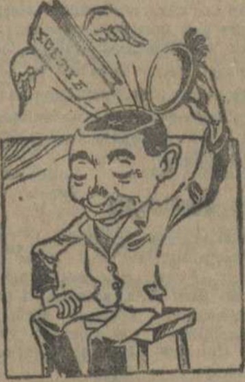
Вытворча-бытавыя коммуны выліжэлі ў райкоме з галавы.