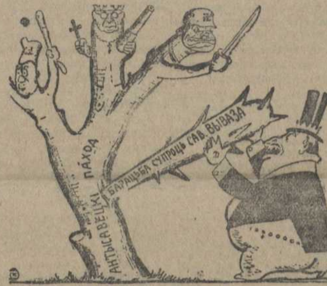
У КАПІТАЛІСТЫЧНЫМ САДЗЕ

Францускі імпералізм імкнецца арганізаваць эканамічную блэкаду СССР. З гэтай мэтай савет міністраў прыняў дэкрэт, якім уводзяцца спецыяльныя дазволы на ўвёз некаторых прадуктаў савецкага паходжання (3 газэты).