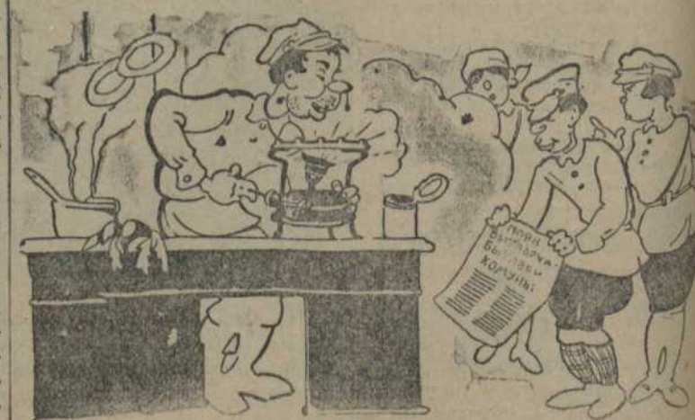
— Што о-о-о! Памяшканьне для комуні! Да комунізму ішчы даўна,—пасьмеяе!