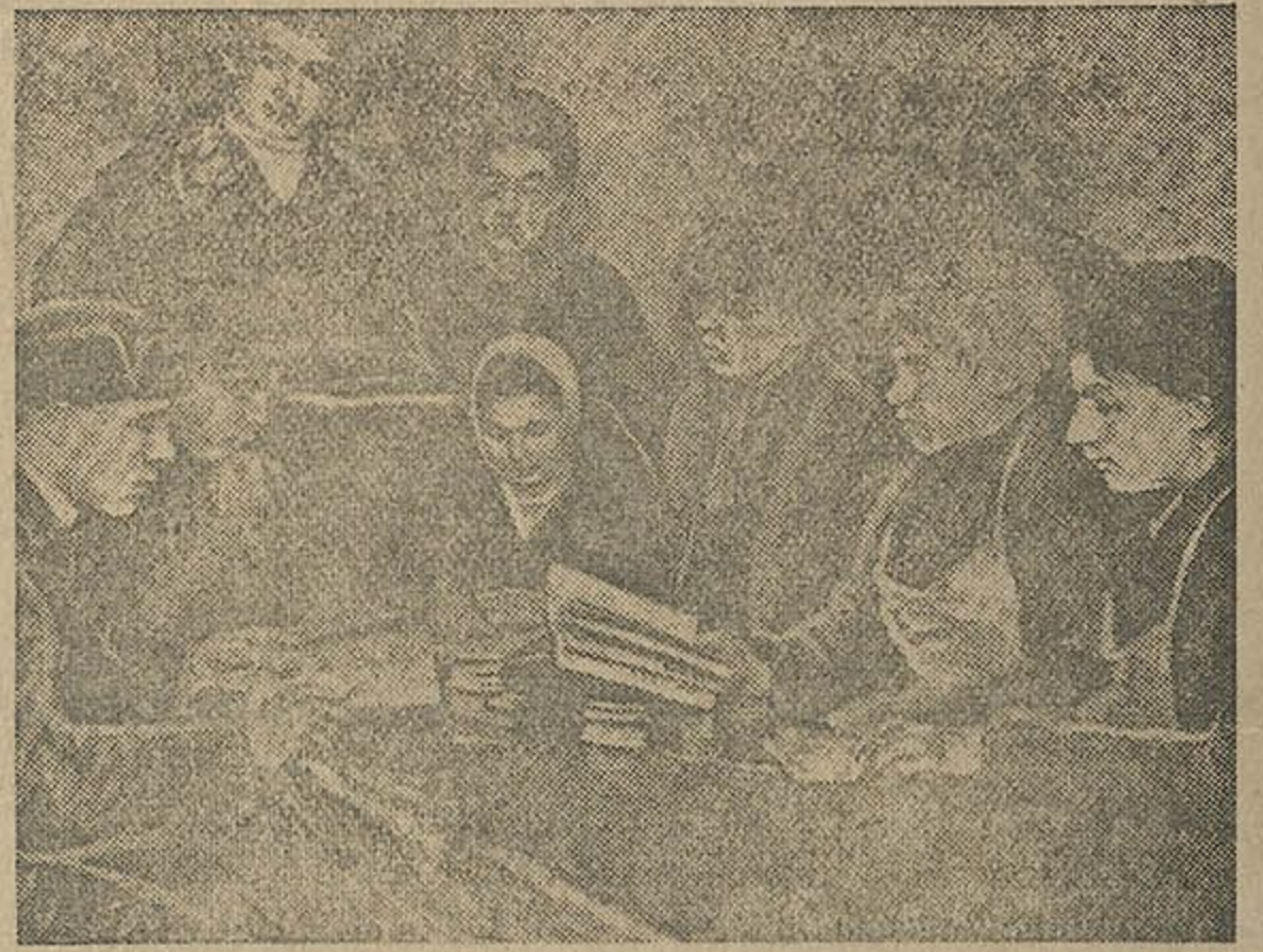
На здымку: Комсамольцы колгасу „Ленінец“ Бронніцкага р-ну прапрацоўваюць плян пасеўнай кампаніі.

Плянны да вёсак і да аднаасобных гаспадарак не дасяганы.