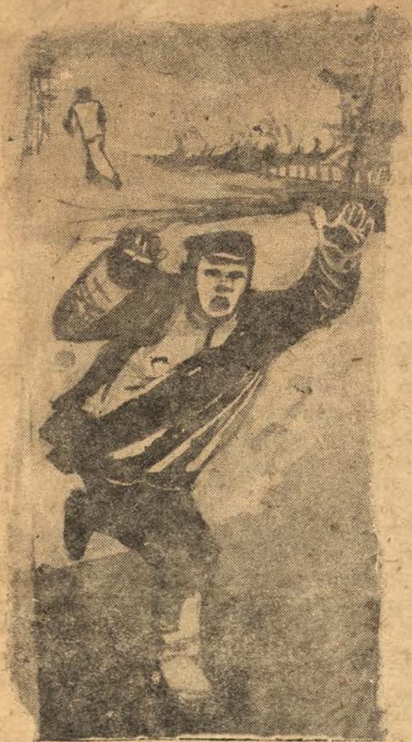
Ён пабег у лагер з крыкам: „Прапруджвае! Прапруджвае!“

І хлопцы дзядзькі Белара ўскочылі на ногі ўсе разам. І сям дзядзька Белара, чыхнуўшы, прачнуўся. Ён прачнуўся і адразу адзеў шапку. У лагера білі барабаны, па лагера грывела трывога. Разгарнуліся сцягі. Зазіялі пражэктары. І ўдарылі аркестры.