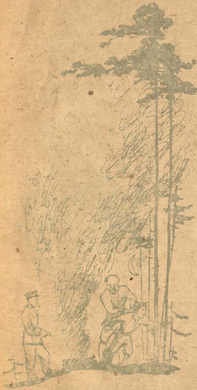
Лёкай злавіў мяне, прывёў на вогнішча.

— Захацелася нам каля агню таксама пагуляць. І мы на панскім выгане запалілі цэлы лом. А тады не можна было без дазволу. Тады-ж была паншчына і ламы былі панскія. А мы—ведама дзеці: запалілі і цераз агонь