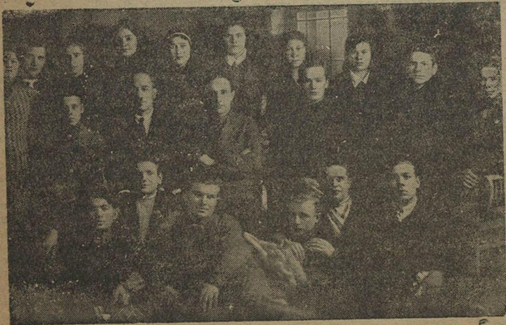
Трэці выпуск 2-х месячных курсаў кніжных работнікаў спажкаапэрацыі.

3. На працягу 3-х месячніка значна ўзмацнілася кіраўніцтва кніжнымі полкамі сельСТ і кнігарнямі ніжэй раённага цэнтру. Аб'езд, інструктаваньне кніжных