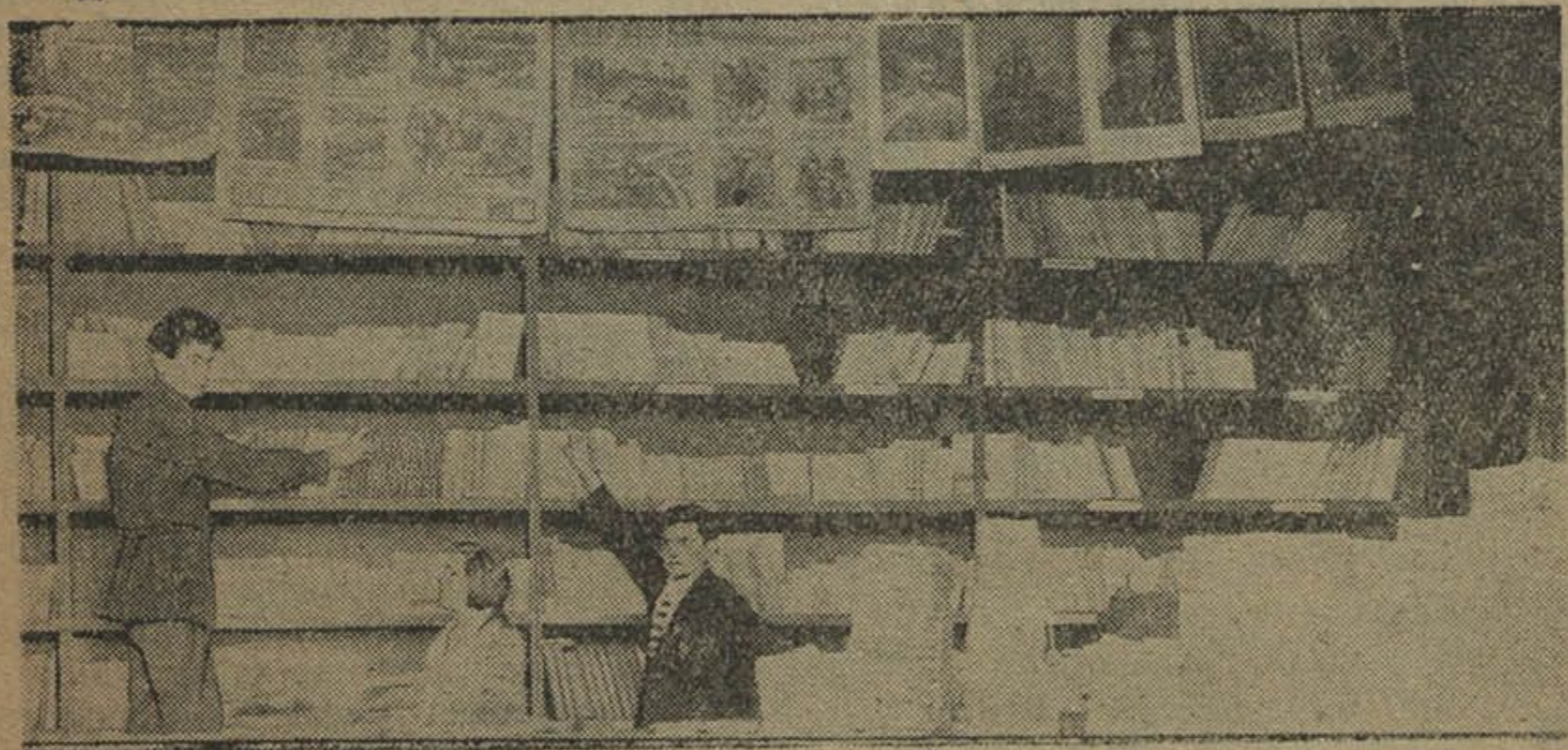
Ельская Кнігарня РСС.

Раённыя арганізацыі езьдзяць у Менск закупаць літаратуру, а загадчыкі кнігарань, ня маючы поўнага асартымэнту, зусім ня турбуюцца пра абслугаваньне