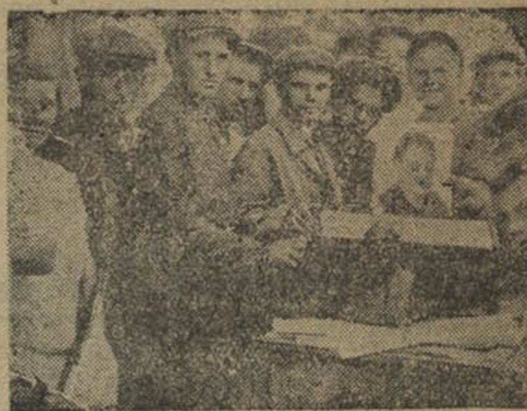
Бяспроігрышная кніжная лётарэя наладжаная Бярэзінскай кнігарняй РСС.

РСС стаяла ў баку і моўчкі назірала ганебную работу сваёй кнігарні. Так Жлобінскі Райспажссоюз даводзіць кнігу да працоўных. Кнігі, якія ставілі сабе мэтай мабілізацыю мас вакол задач, пас