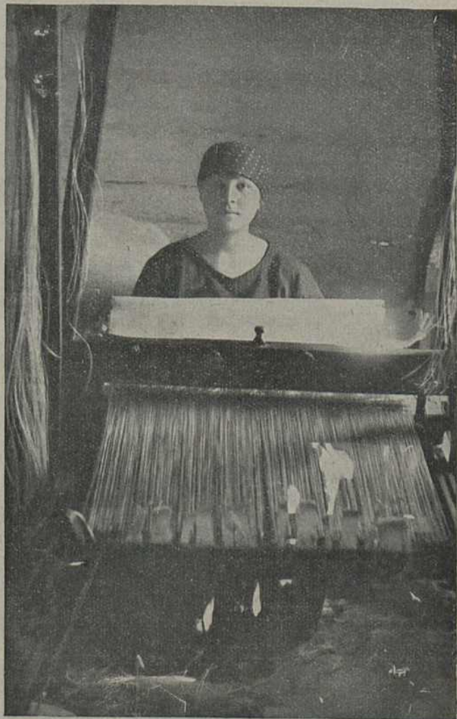
Ткачыха ў дрэвапрацэскай прамысловасьці за працай.

У часе адпачынку на абедзенны перарыў, пасьля заняткаў, ён толькі-што пакупаўся ў Сьвіслачы і ляжаў пад кустом вербалозу. Узьлёг жыватом на землю, падлёр рукамі галаву, уперыўся вачыма за