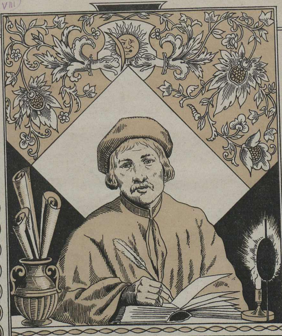
Ф. СКАРЫНА Першы беларускі вучоны і друкар