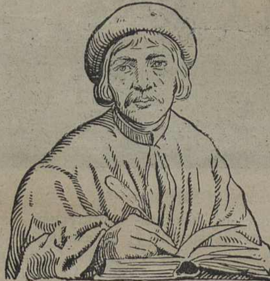
Ф. Скарына за працаю.

часу—Францыск Скарына і ў сваім сьветапоглядзе адбівае адзнакі гэтых абедзвюх эпох. У сярэднія вякі, калі панавала натуральная гаспадарка, тэхніка была вельмі слабая, чалавек залежаў ад стыхійных сіл прыроды; на падставе гэтай залежнасьці разьвіваецца рэлігійны настрой, чалавек адчувае сябе цацкаю ў руках нейкай таёмнай сілы. Наш беларускі дзеяч падзяляе гэту рэлігійнасьць свайго часу і лічыць, што крыніца ўсіх навук ёсьць біблія; воль чаму ён, задаўшыся мэтамі дапамагчы культурна-асьветнай справе роднага народу, перакладае на беларускую мову і друкую не якую-небудзь іншую