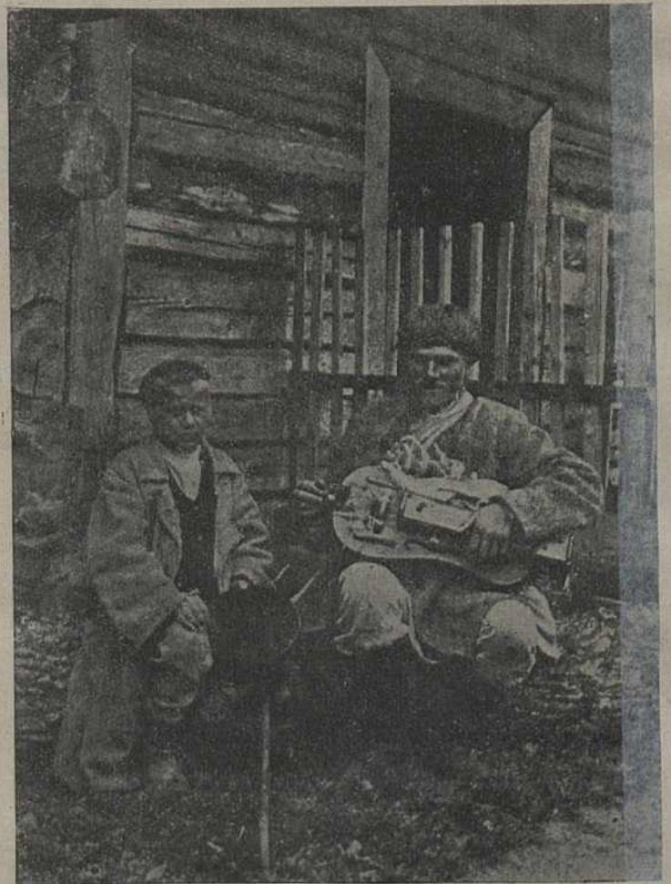
Беларускія тыпы. Лірнік-жабрак з павадыром.