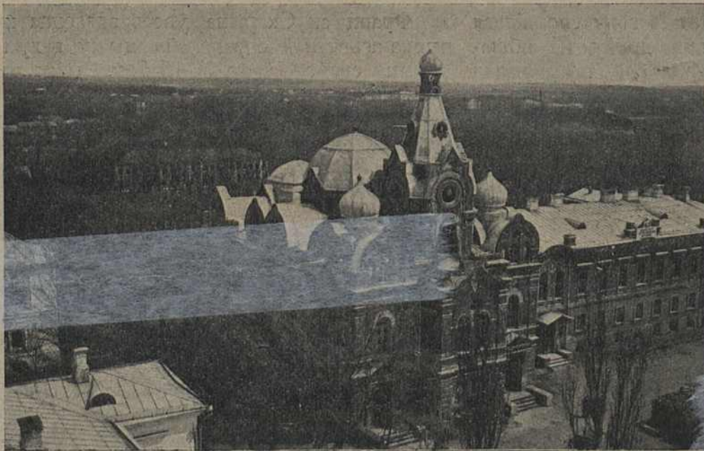
Беларускі Дзяржаўны Музей у Менску.

юбілей выдадзеных ім кніжак, як паказчыкаў тагочаснай культуры, якая зьявілася ў нашыя дні грунтам для развіцця беларускай рабоча-сялянскай культуры.