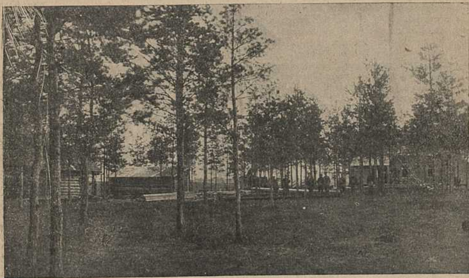
Сядзіба гадавальніка Белкахотсаюзу. Агульны выгляд.