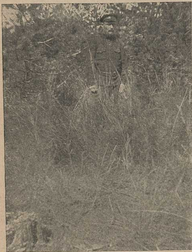
Снимок жерновца весной. Сравнение величины куста с ростом человека.

должен упоминаться темный дремучий лес; в природе же это бывает не совсем так, а именно—волки бывают не только лесные, но и степные, хотя, конечно, эти два вида—очень и очень близки друг к другу. Если же говорят, что степной волк имеет другой окрас, то это вполне понятно, т. к. тут играет роль приспособляемость индивидуума к окружающей обстановке в природе, т.-е. к окрасу предметов, кои сходны по своим краскам и колориту с окрасом шкуры зверей и оперения птиц.