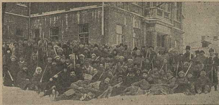
Віцебскі гарадзкі колектыў паляўнічых.

Эти цифры с величайшей убедительностью говорят за то, что мы много теряем на ранней охоте на пушного зверя.