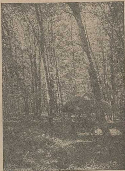
Ясель для падкормкі дзікіх коз.

шых браканьёраў. За мінулы паляўнічы год выяўлена выпадкі адстрэла браканьёрамі двух дзікаў: аднаго ў Бельнавіцкім і другога ў Магілёўскім раёнах. Браканьёры прыцягнуты да адказнасці.