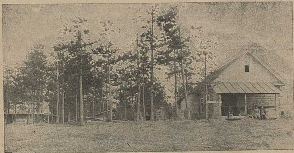
Сядзіба гадавальніка паляўнічых сабак Белкахотсаюзу.

Но само собой разумеется лучше всего, если прививку произведет ветеринарный врач.