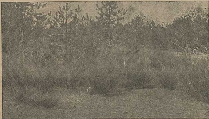
Кусты жерновца по выходе из-под снега.

Везде и всегда главная роль в жизни волков отводится матерой волчице — матери, хотя в действительности, в природе, главой семьи является матерый самец — отец — ее кормилец, вождь и защитник.