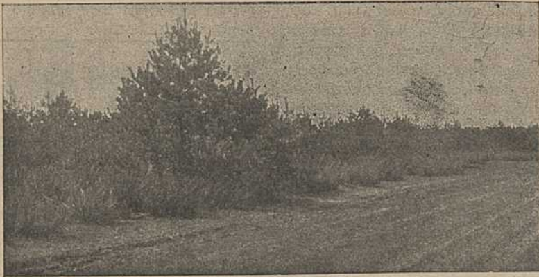
Общий вид посева жерновца в Бешенковичском районе Витебского окр. Засято в конце апреля по выходе жерновца из-под снега.