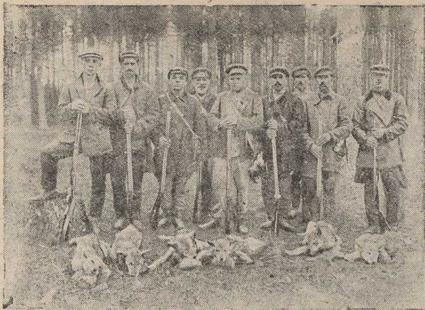
Паляўнічыя Бялыніцкага т-ва паляўнічых на аблаве. Унізе ляжаць 6 забітых ваўкоў.

і боепрыладамі. Між тым, Заслаўскае раённае таварыства паляўнічых прэміраваць ня хоча. Гэтым самым адбіваецца жаданьне паляўнічых на барацьбу з ваўкамі. Трэба раз назаўсёды ўстанавіць