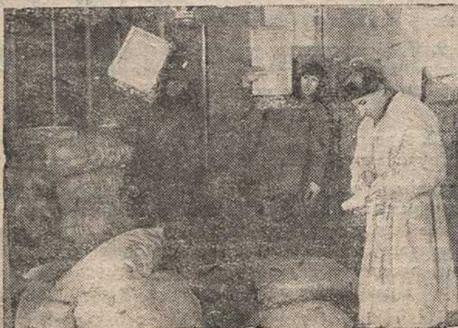
Прымь прыбыўшай пушмехсыравіны в Бышава, Чачэрску, Нароўлі, Слуцку і інш. раёнаў (база Саюзпушніны).