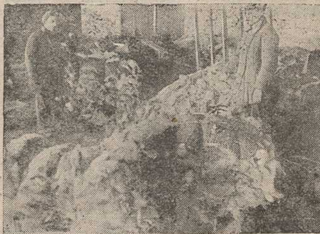
Склад гатовых мехавых вырабаў (база Саюзушніны).

Самацёк зараз больш, чым калі-небудзь. Небясьпечны для справы разьвіцця сельскай гаспадаркі, самацёк зараз можа пагубіць усю справу (з прамовы тав. Сталіна на аб'яднаным пленуме ЦК і ЦКК УсеКП(б))