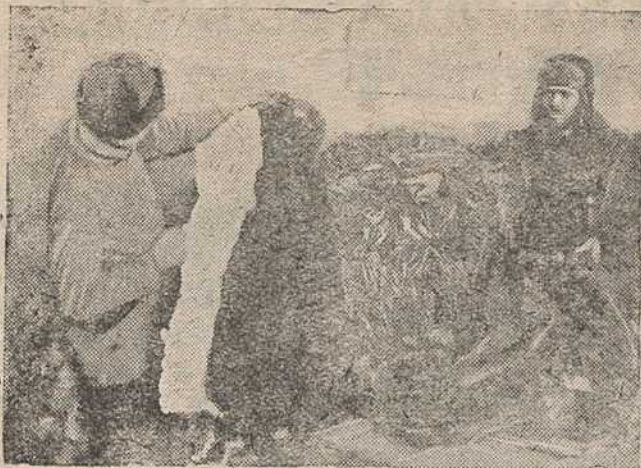
Упакованы эксперты зайц (база Саюзушніны).

Не падлягае ніякаму сумненню, што асноўнай прычынай незадавальняючай работы трактарнага парку зьяўляецца нізкая кваліфікацыя трактарыстаў. У выніку каштоўнейшыя машыны выходзяць з строю іншы раз дзесяткамі. Дастаткова зрабіць спасылку хаця-б на мінулы сельскагаспадарчы год, калі процант паломак і прастояў асабліва ўзрос, каб упэўніцца ў тым, што задача ашчаднага выкарыстання, хавання і добракаснага рамонту трактараў стала ва ўвесь рост.