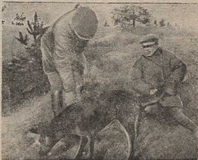
У час адпачынку паляўнічыя вучаць сабаку.