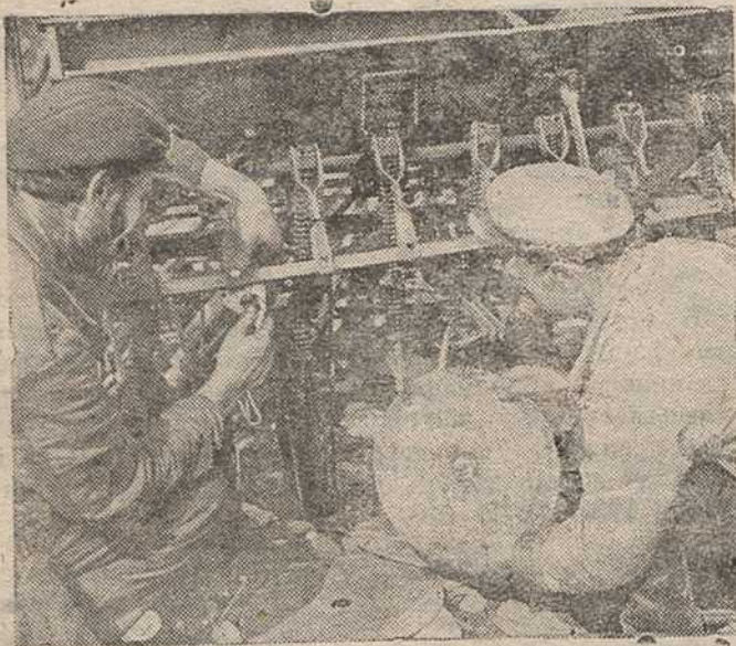
Ва ўсіх канцох Саветскага Саюзу ідзе шпаркая падрыхтоўка да вясенняй пасеўнай кампаніі.

Яны бачаць таксама, які шматмільённы, нявычарпальны рэзерв маецца ў рабоча-сялянскай Чырвонай арміі Саветскага Саюзу—рабочыя асоавіяхімаўскія палкі. Ім здаецца за гэтымі радамі сініх блуз і чорных кепак Чырвоная гвардыя паўстаўшага прале-