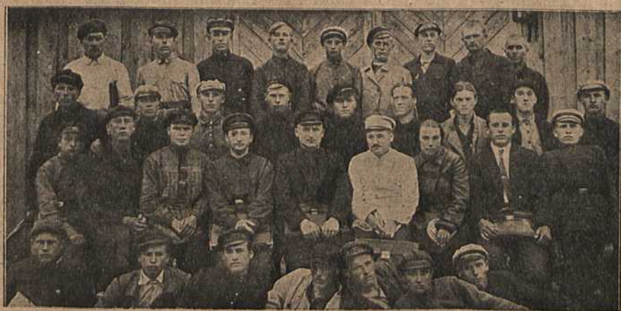
І Усебеларускія мэліарацыйныя курсы для сялян.

Ініцыятыва па ўтварэнню гэтых таварыстваў у большасці выпадкаў належыць актыву вёскі. Але гэтаму актыву, яшчэ мала сьвязьдомаму ў справе асушкі і распрацоўкі балот, надта цяжка весці за сабой цёмнае сялянства, якое з недаверрам глядзіць на гэта.